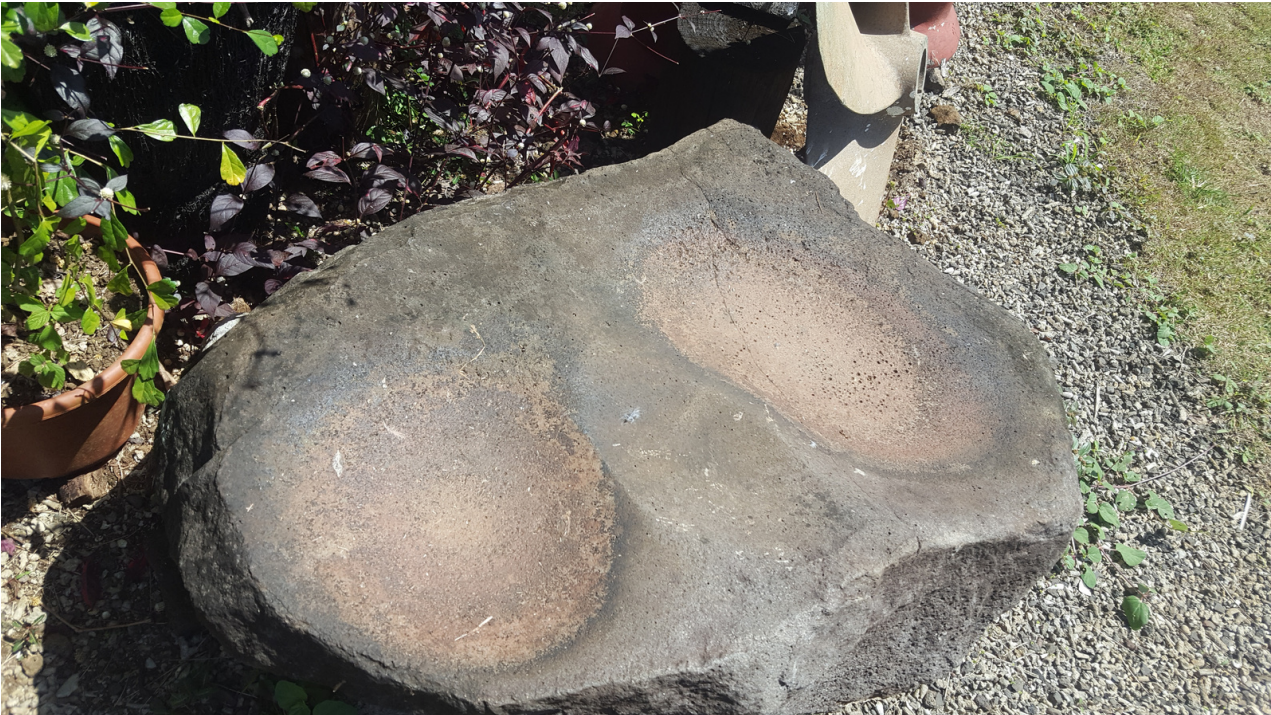
Foliga atoa o le foaga 8, faamauina