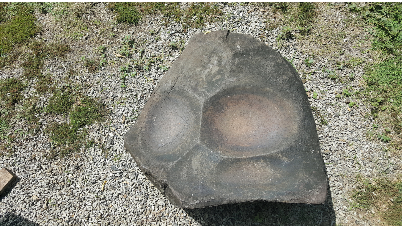
Foliga vaaia o le foaga 9, faamauina.