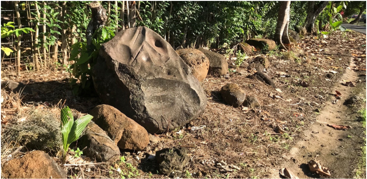
Tasi lenei o foaga sa faamauina i le itu i sisifo o le auala.